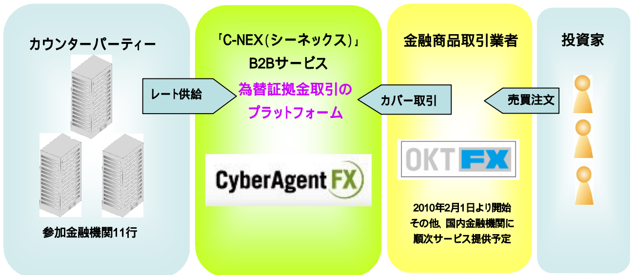
「C-NEX(シーネックス)」B2B サービス 概念図

これにより同社に対し、2010年2月8日よりカバー取引サービスの提供を開始致します。