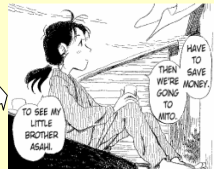
夕風の街 桜の国/Town of Evening Calm, Country of Cherry Blossoms (C)Fumiyo Kouno 2003 / Futabasha