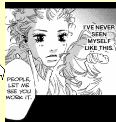
ウォーキン・バタフライ/walkin' butterfly (C)2005 Chihiro Tamaki / Ohzora Publishing